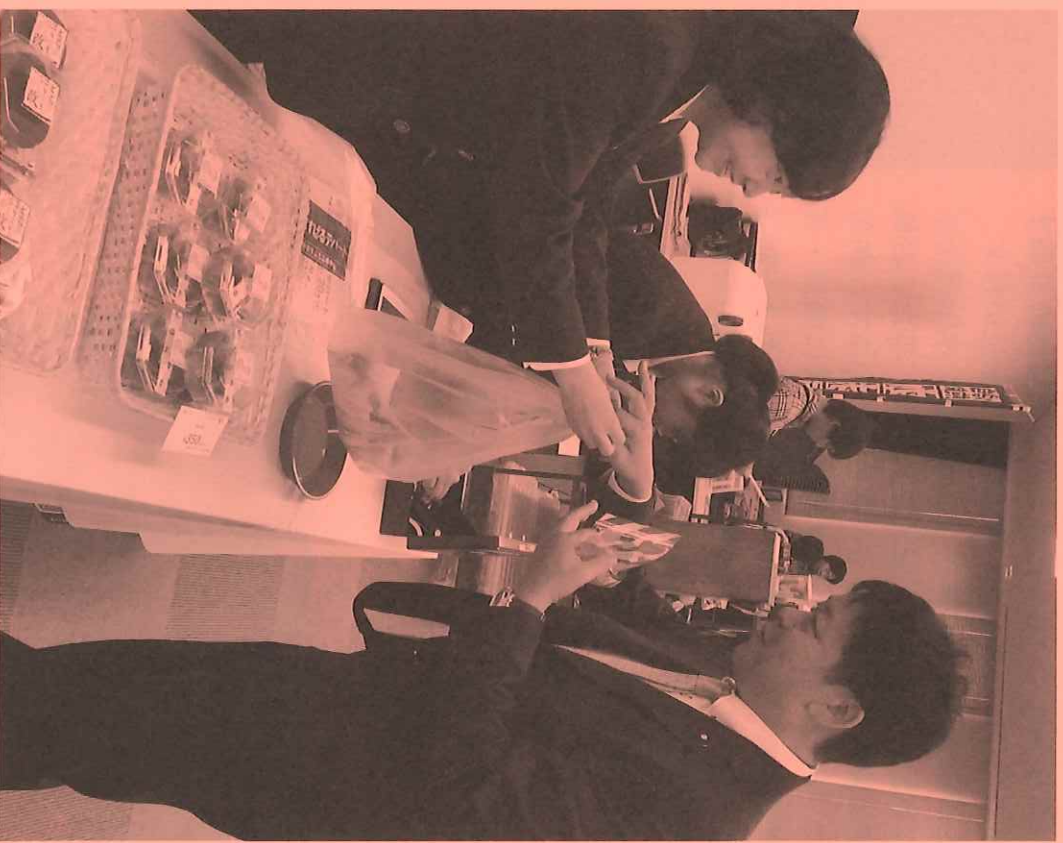
◆KYOOのあけぼのフェスタで、高校生たちが考案し手作りした、おいしそうなパンを買う（10月）