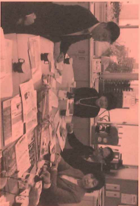
◆横浜布で地域・学校の連携施設を視察（1月）